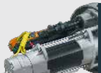
Electrofreio com cabo de 8m Electrofreno con cable de 8m Électro-frein con cable de 8m Electrobrake with 8m cable